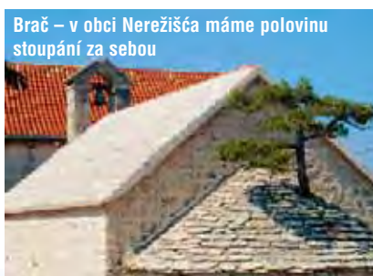
Brač – v obci Nerežišća máme polovinu stoupání za sebou