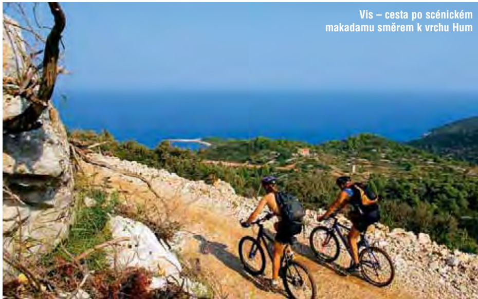
Vis – cesta po scénickém makadamu směrem k vrchu Hum