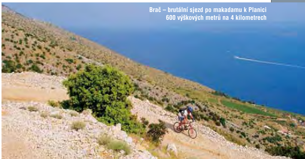
Brač – brutální sjezd po makadamu k Planici 600 výškových metrů na 4 kilometrech

Tam se cesta rozdvouje: kdo dá přednost nezpevněné šterkovo-kamenité cestě (zde „makadamský put“ nebo zkráceně „makadam“), dá se za kostelem doprava, do zprvu značného stoupání. Kdo trvá na pevném asfaltovém povrchu, míří za kostel rovně, aby se po necelém kilometru znovu napojil na hlavní. Po ní jsou to tři kilometry „serpentinoidního“ stoupání k odbočce na Vidovu goru. Ukazatel říká méně, ale z odbočky na vrchol pojedeme sedm kilometrů. Budiž nám útěchou, že na odbočce už máme většinu stoupání za sebou a čeká nás velmi příjemná, pestrá, houpavá úzká asfaltka převážně skrz voňavý borový les, pro nějž má chorvatština poetický název „šuma“. Po necelém kilometru od odbočky se zprava připojí zmíněná makadamová cesta od Nerežišć. Je to původní středověká vozová cesta