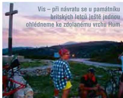
Vis – při návratu se u památníku britských letců ještě jednou ohlédneme ke zdolanému vrchu Hum

Od přístavu vedou do kopce, jihovýchodním směrem, dvě silnice. Obě se stýkají na něco přes tři kilometry vzdáleném návrší na křižovatce cest u pomníku