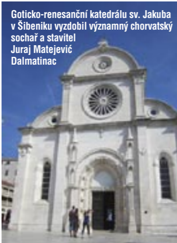
Goticko-renesanční katedrálu sv. Jakuba v Šibeniku vyzdobil významný chorvatský sochař a stavitel Juraj Matejević Dalmatinac