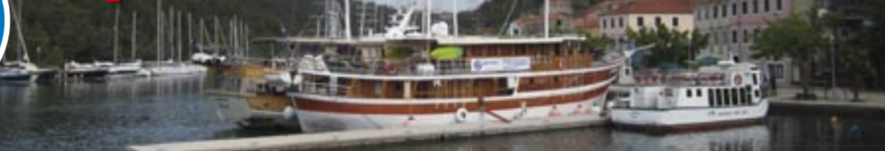
Loď Tvrdí kotví v jachtařském přístavu města Skradin