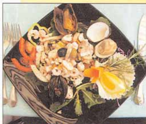
MOŘSKÝ MIX může být zajímavý. Případně i nebezpečný