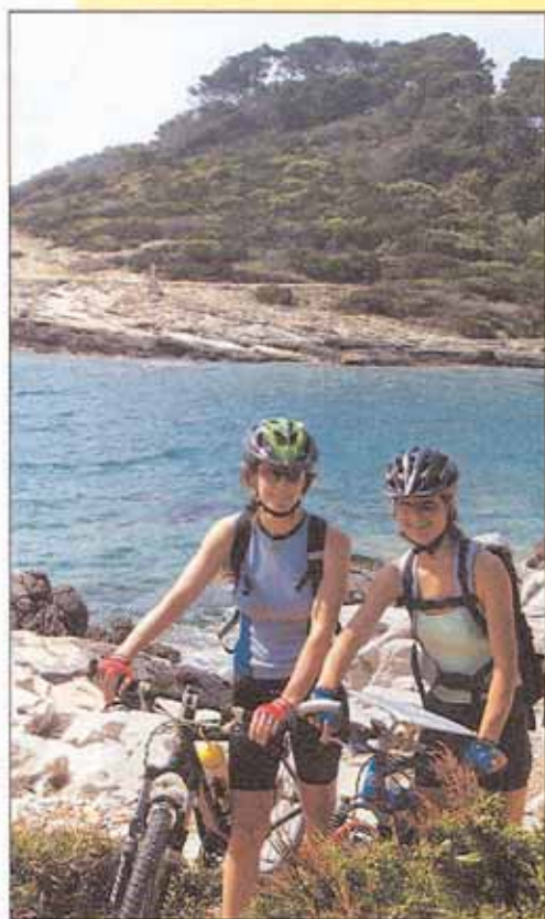
NA POBŘEŽÍ OSTROVA MLJET, ráje s cedrovými lesy