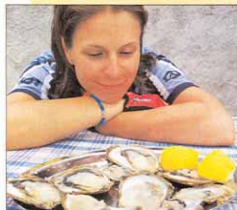
NA ÚSTRICE je nejlepší starořímské městečko Ston a jeho okolí