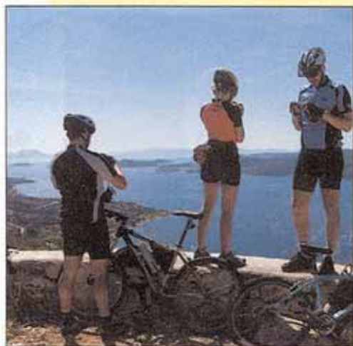
DD GOTICKÉHO KOSTELA Gospa od Karmena není vůbec špatný výhled

V úterý ráno zakotvíme v přístavu Sudjuradj na ostrově Šipan, jemuž se kvůli četným kulturněhistorickým památkám, pocházejícím hlavně z období renesance, říká „renesanční ostrov“. Nově zrekonstruovaný letní palác rodiny Stepovič-Skočibuhů, významných rejdářů, bankéřů a obchodníků z 16. století, je opravdu bombastický. Prohlédneme si reprezentační sály zámku, nově vysvěcenou kapli, černou kuchyň s původní pecí na chléb a překrásnou zahradu, jednu z dominant komplexu. Stará lisovna oleje slouží dnes jako zajímavé gastronomické zařízení, kde se podávají místní speciality (Sudjuradj je pověstný zejména svými langustami). Krátký výlet na kolech trochu znepríjemňují tabulky podél cesty. Lebky se zkříženými hnáty varují před vstupem na louku, kde se stále nalézají miny z dob srbsko-chorvatské války. Návrhy na skutečně adrenalinovou projížďku minovým polem naštěstí neprojdou – případ nizozemského turistu, jemuž mina na ostrově Vis utrhla nohu, dokazuje, že to bylo moudré rozhodnutí. Před odplutím do Dubrovníku se koupeme v zátoce u ostrova Lopud. Skoky do vody z horní paluby, projížďky na kajaku, šnorchlování. Podle týden staré předpovědi BBC by se k večeru mělo zkazit