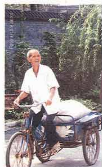
Zapadlá vesnice. Cestování po Číně bývá dobrodružné. Rikšové vám totiž pokaždé ukáží jiný směr.

Po několika hodinách jsme zastavili. Kolem jen pole a hory. „Musíme jínudy,“ sdělil nám řidič. Lidé z nedaleké vesnice totiž cestu zatarasili balvany a nehodlali je odvalit, dokud nezaplatíme. Kus jsme se tedy vrátili a vydali se jínudy. Značení ale chybělo, a tak řidič každou chvíli přibížděl a ptal se, kudy do Čchen-fia-kou. Lidé však buď utíkali, nebo jen krčili rameny. Muž vezoucí na rikše starý papír se