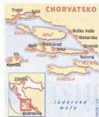
Na Vis je možné doplnout na jachtě nebo se sem přeplavit trajektem ze Splitu (2 - 3 hodiny). Ubytování tu na jaře a podzim přijde zhruba na 1000 Kč za dvouúložkový pokoj.

soused Darko nás zavedl k tajemnému vchodu. Bunkr nebyl nikdy úplně dokončen a dnes je volně přístupný. Jen zaklínáme naše jediná dvě světla, aby nezhasla najednou, protože labyrint stametrových chodeb