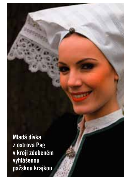
Mladá dívka z ostrova Pag v kroji zdobeném vyhlášenou pažskou krajkou

Co se týče tradičních jedinečností, řadí se Chorvatsko počtem zápisů na Seznamu nemateriálního dědictví UNESCO ke světovým jedničkám (pro srovnání – Česká republika