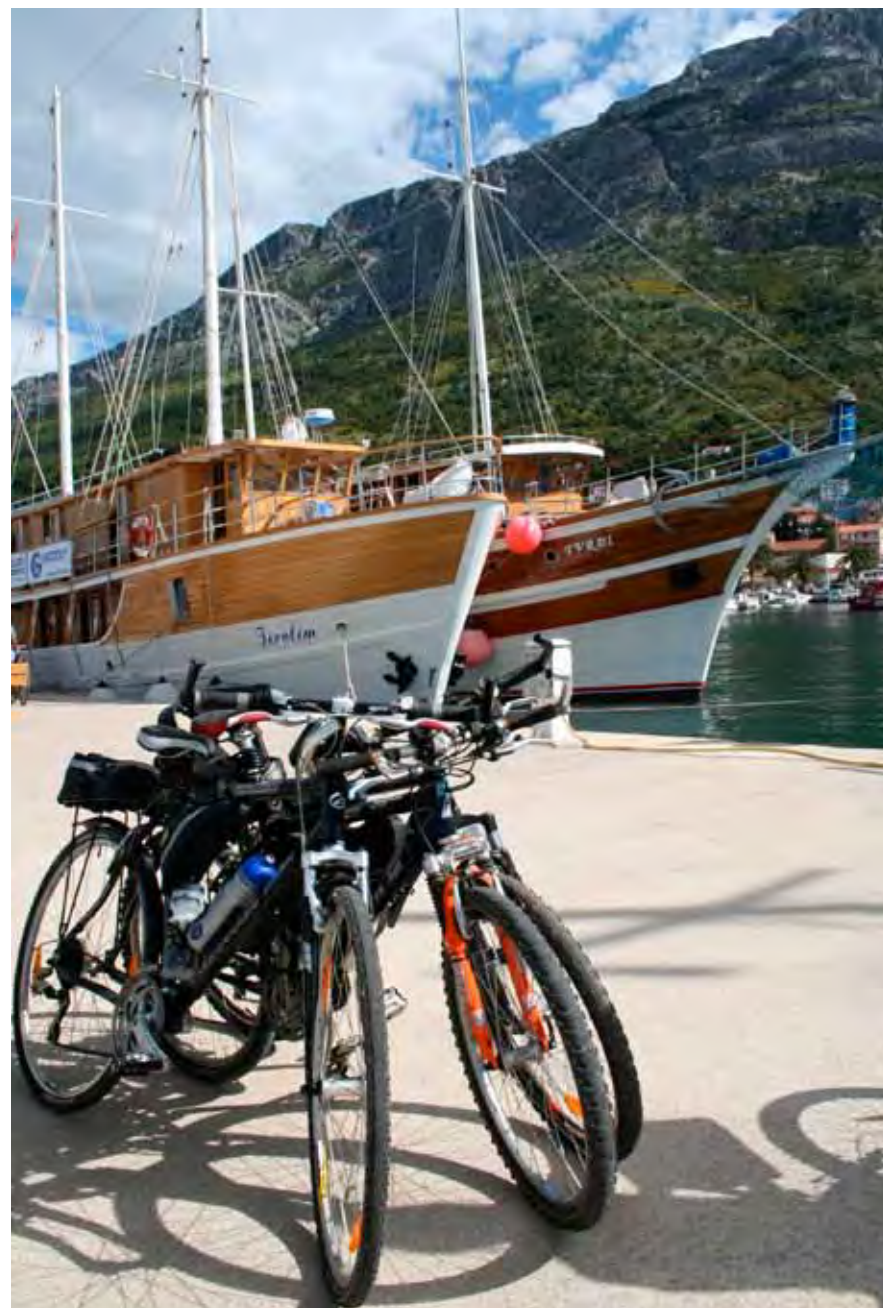
Plachetnice a kolo jsou ideální a zároveň romantickou kombinací pro objevování tradic Chorvatů