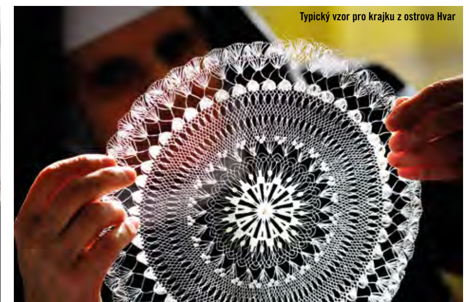
Typický vzor pro krajku z ostrova Hvar