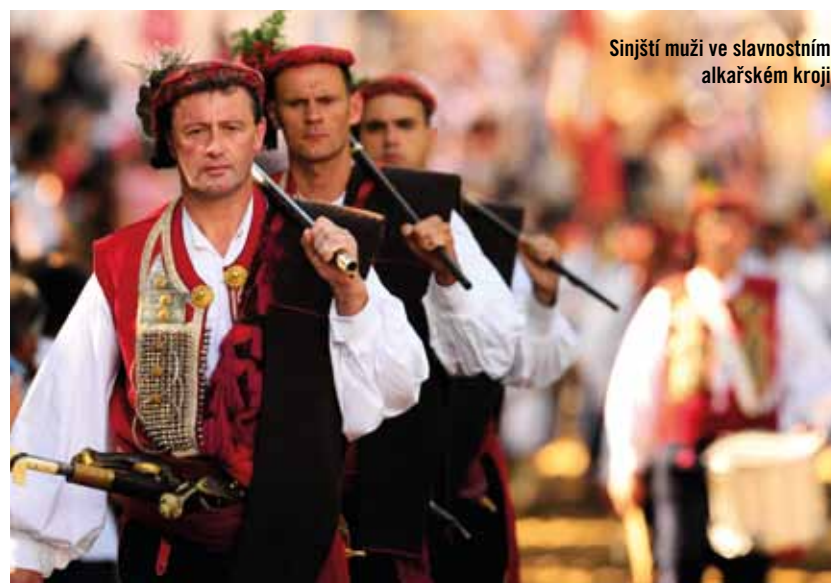
Sinjští muži ve slavnostním alkašském kroji

V den slavného výročí se ustrojí sinjští muži do alkašského kroje zdobeného zlatem a stříbrem, často doplněného i bambítkami nebo palcáty, a ti nejzdatnější se pouštějí za zvuku podmanivé hudby a víření bubnů do náročného bojového klání. Snaží se