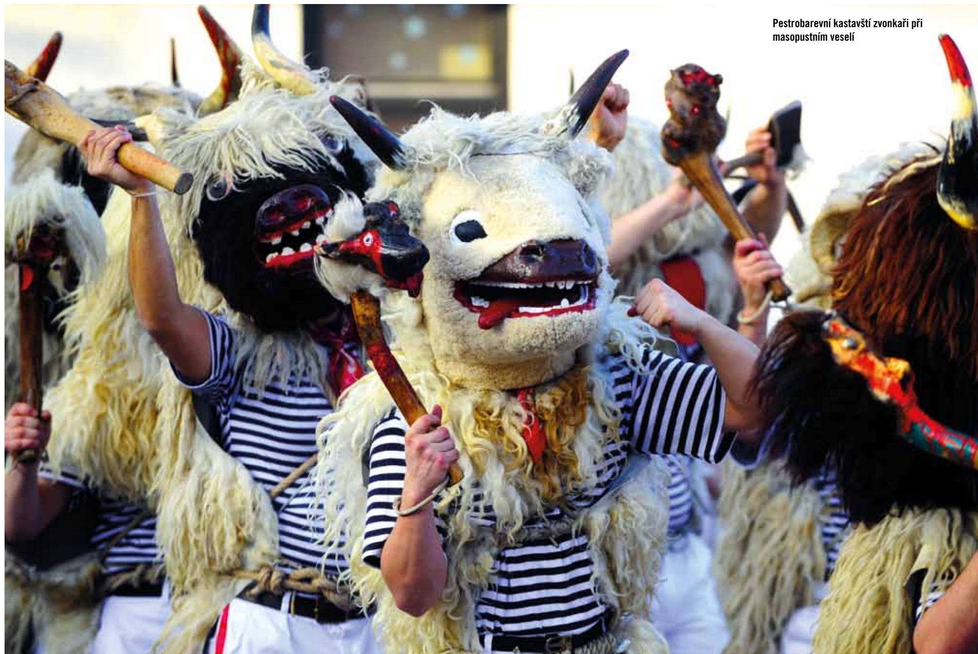
Pestrobarevní kastavští zvonkaři při masopustním veselí