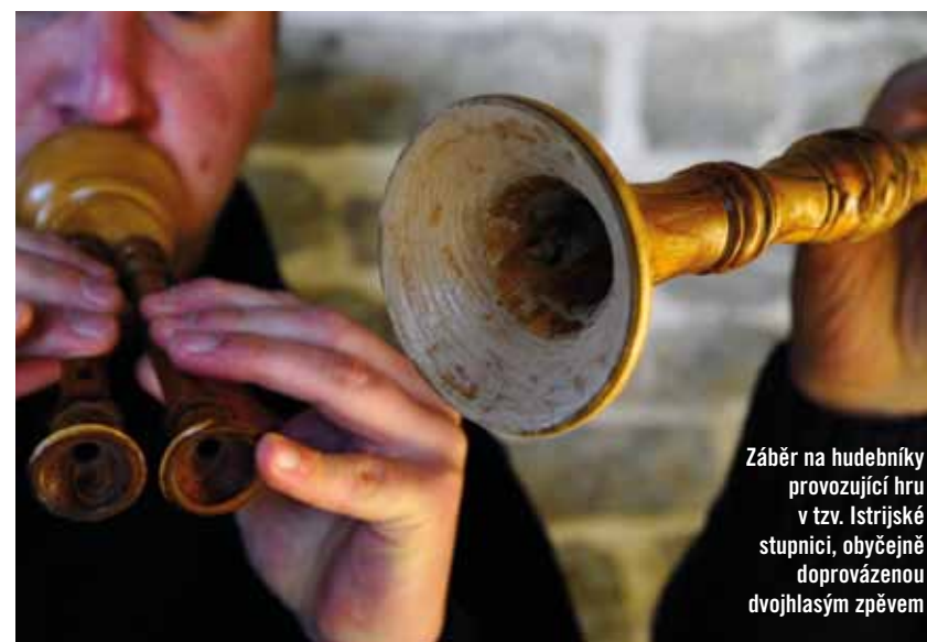
Záběr na hudebníky provozující hru v tzv. Istrijské stupnici, obvykle doprovázenou dvojhlasým zpěvem