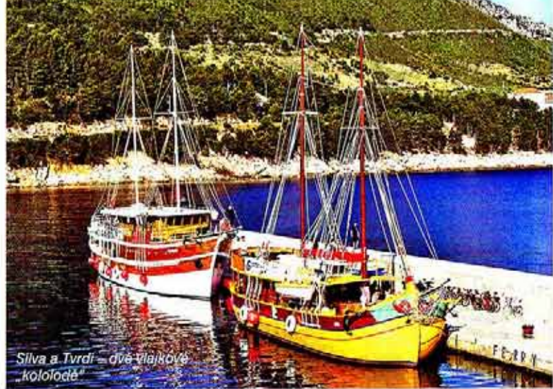
Silva a Tvrdi – dvě vlábné kolo-lodi

Na tvých zájezdech si lidé sami určují tempo i obtížnost trasy. Ráno rozdělíte