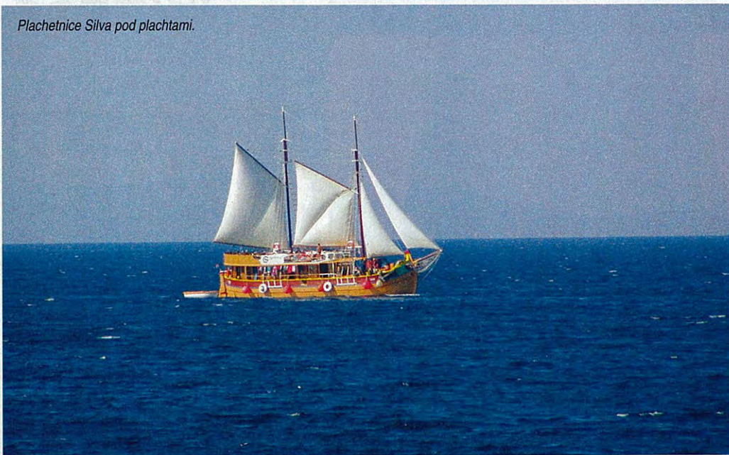
Plachetnice Silva pod plachtami.

Pěstuje se tu vinná réva, olivy, ovoce a zelenina, i když na ostrově chybí pramen sladké vody a rostliny zavlažuje pouze rosa nebo déšť. Roste tu také zvláštní druh kyselých pomerančů, které používají hospodyně k přípravě ryb.