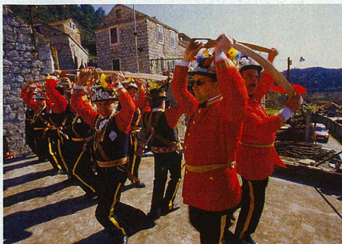
Na Lastovu jsou vyhlášené slavnosti masopustu.

do nadmořské výšky 415 metrů. Odtud se naskýtají nádherné výhledy na celý ostrov i na nedalekou Korčulu. Na vrcholu kopce je přistávací plocha pro helikoptéry, které v případě nutnosti zajišťují místním obyvatelům odvoz do nemocnice na některém z větších ostrovů.