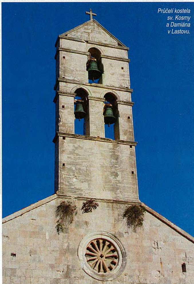
Průčelí kostela sv. Kosmy a Damiána v Lastovu.

Hluboký záliv s přístavem Ublí na jihozápadě ostrova je dobře chráněn před větry. Vplouvají do něho trajekty obstarávající pravidelné spojení s Hvarem, Korčulou a s přístavy Splitem a Dubrovnikem na dalmatském pobřeží. Příliš turistů sem nepřijíždí, i když stát trajektů dotuje a lidé platí za lodní lístek na nejbližší ostrov Jadranu v porovnání s ostatními vůbec nejnižší částku.