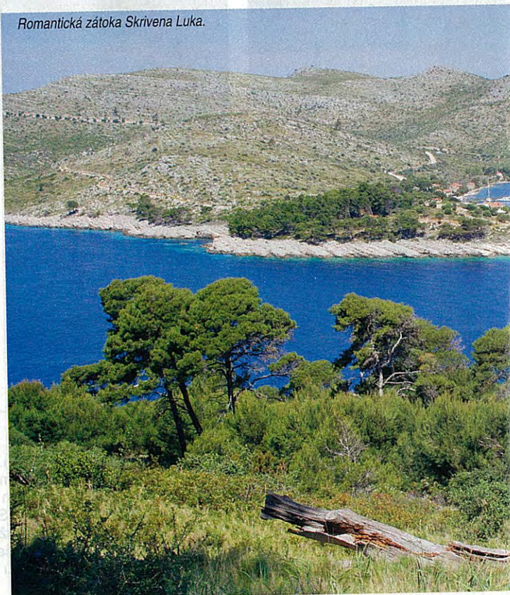
Romantická zátoka Skrivena Luka.

ským ostrovem. Slovanští Neretvané se objevují až v devátém století, o století později ostrov obsazují Benátčané a ve dvanáctém století patří ke knížectví Zahumlje. Na krátký čas podléhá Uhrám a v letech 1252 až 1808 jej spravuje Dubrovnická republika. Po druhé světové válce se ostrov stává součástí Jugoslávie. Armáde se hodí spolu se sousedními